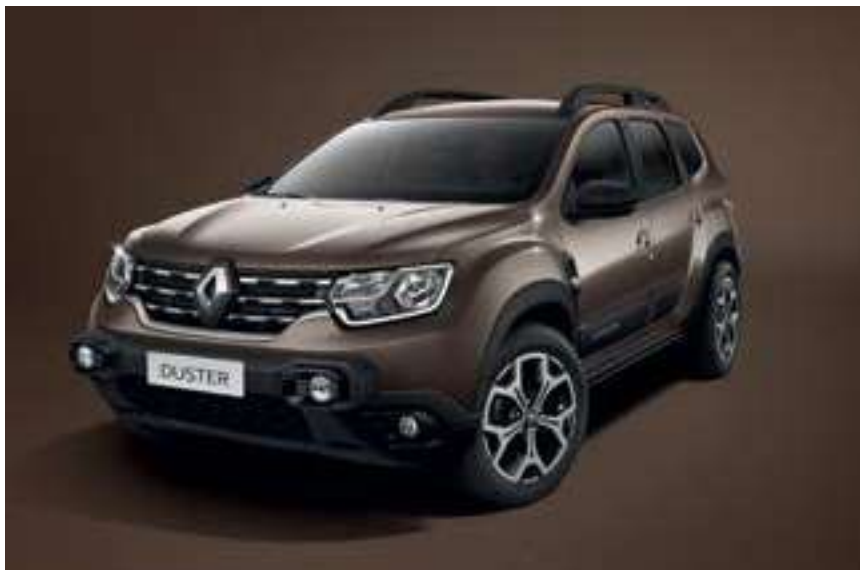
Marrón Vison (CNM)