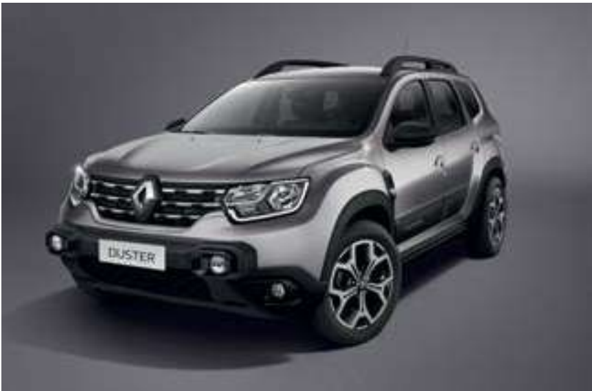
Gris Cassiopée (KNG)