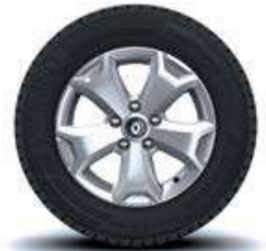
LLANTA DE ALUMINIO DE 16"