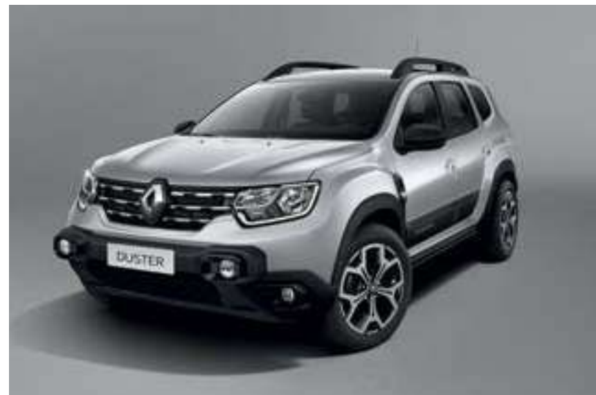
Plata Étoile (KNH)