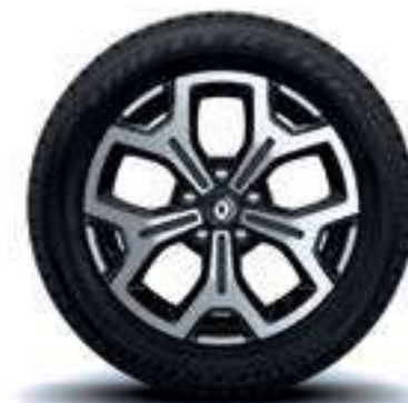
LLANTA DE ALEACIÓN DE 17"