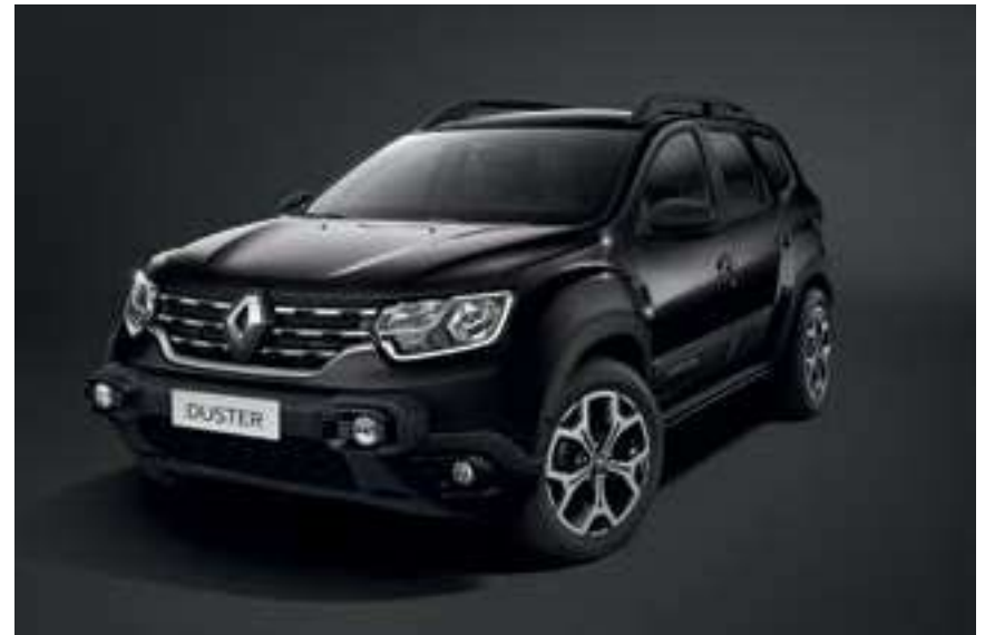
Negro Nacré (676)