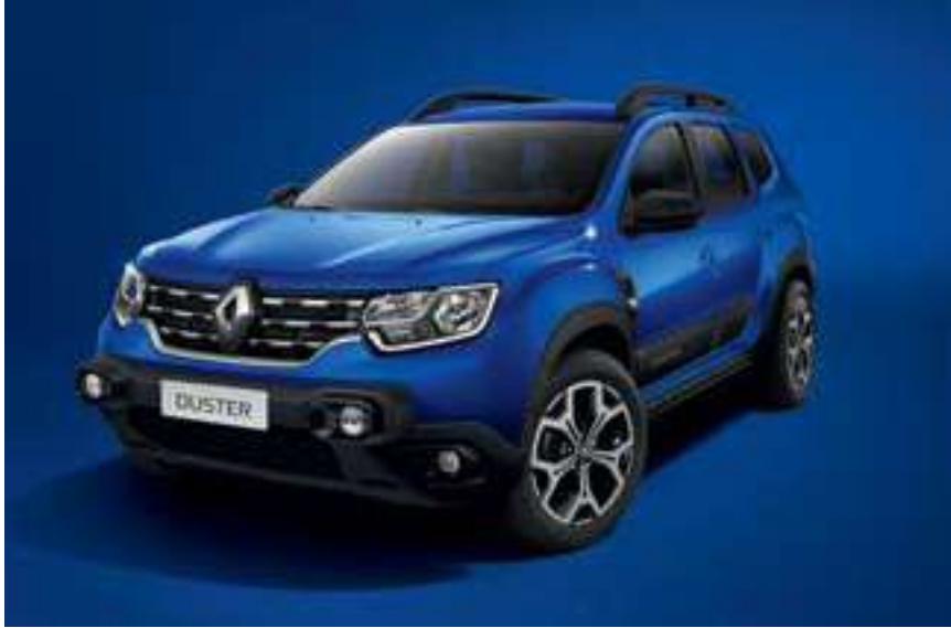
Azul Iron (RQH)