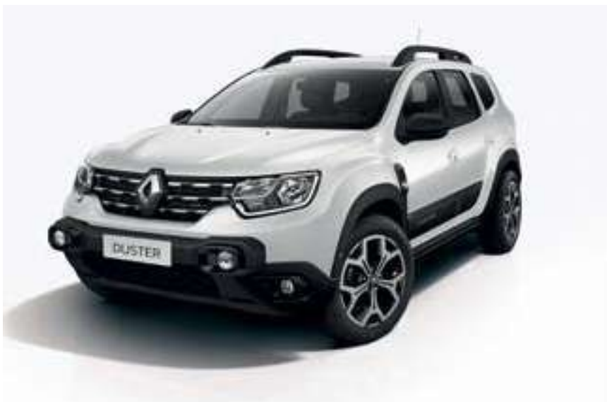
Blanco Glacier (369)