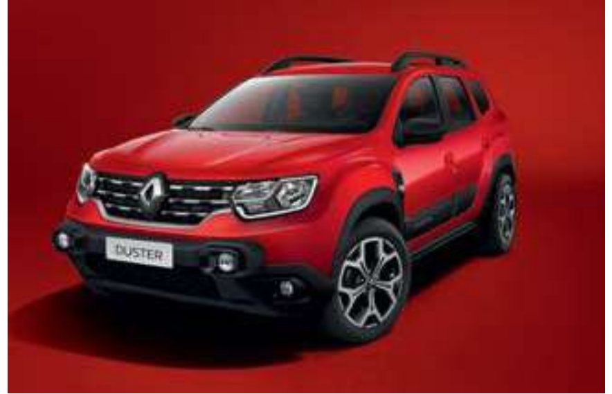
Rojo Vivo (727)