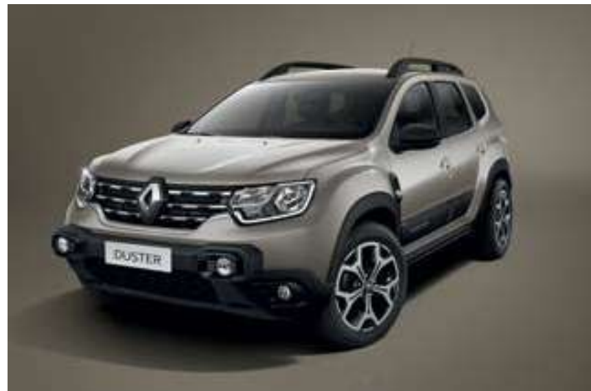
Beige Duna (HNP)