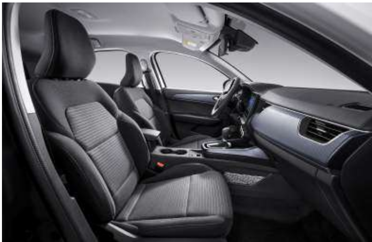
Arkana E-Tech Hybrid